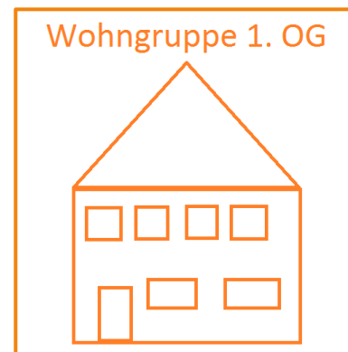
Wohngruppe 1. OG