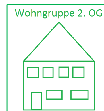
Wohngruppe 2. OG