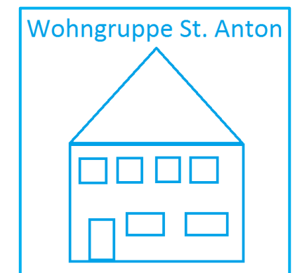
Wohngruppe St. Anton